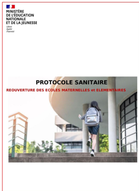
PROTOCOLE SANITAIRE - ÉTABLISSEMENTS MATERNELLES ET ÉLÉMENTAIRES - VERSION PROJET Page 1/13 Document réalisé par le ministère de l'Éducation nationale avec le concours de Bureau Veritas Expérience 29 avril 2020. Les conseils de la présente fiche sont susceptibles d'être complétés ou ajustés en fonction de l'évolution des connaissances. Consulter régulièrement le site education.gouv.fr pour leur actualisation.